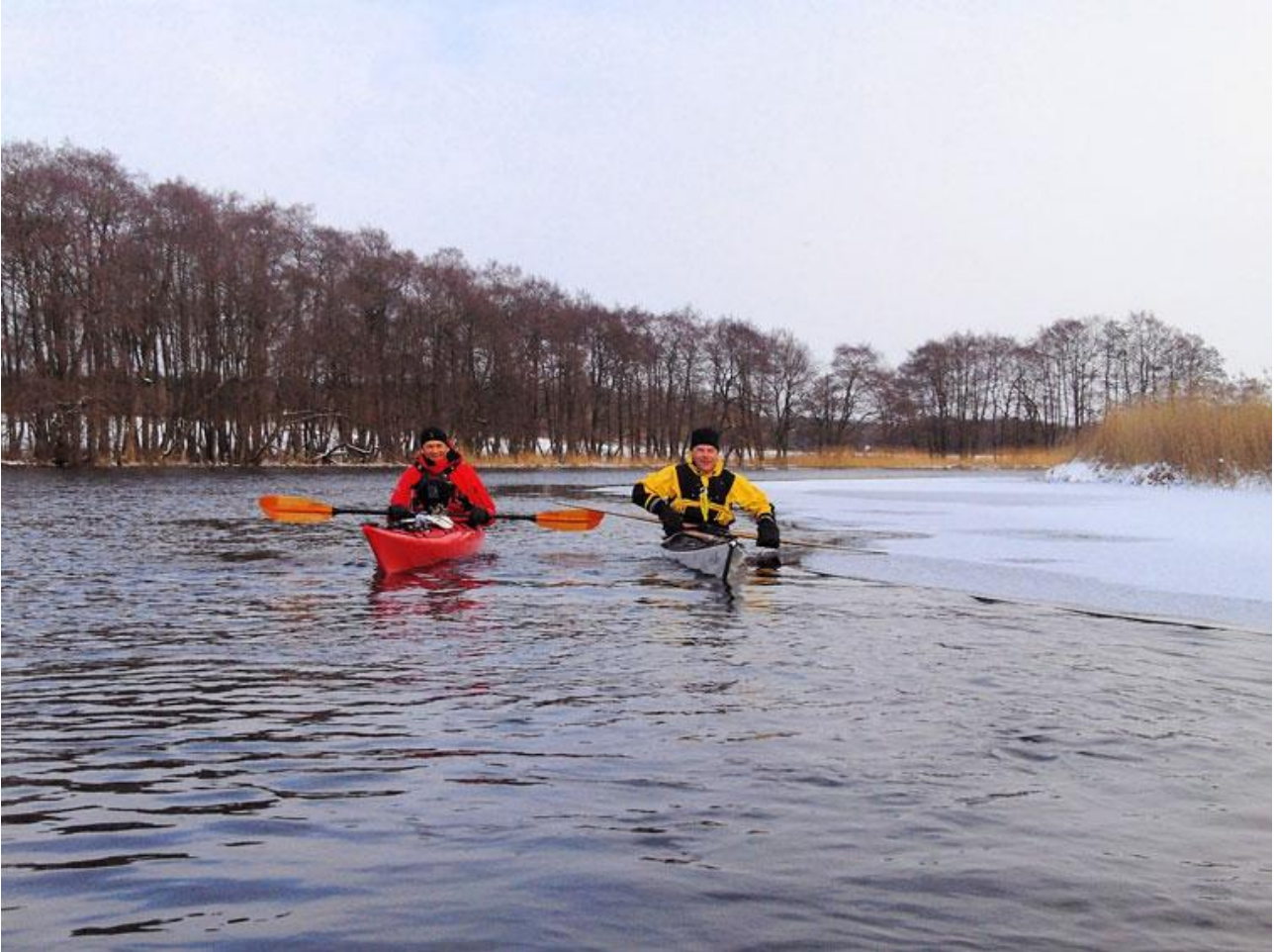
Her: på tur til Mossø og Gudenåen

En lille gruppe hardcore kajakroere i klubben har taget en såkaldt vinterprøve. Den giver tilladelse til at ro i havet i vinterperioden. Kun ca. ti medlemmer i Hou har taget prøven, og det er bare en håndfuld, som benytter sig af muligheden. Ud over prøven kræver det også, at man sørger for en god kvalitet af beklædning og udstyr, så man kan holde kulden ude og varmen inde.