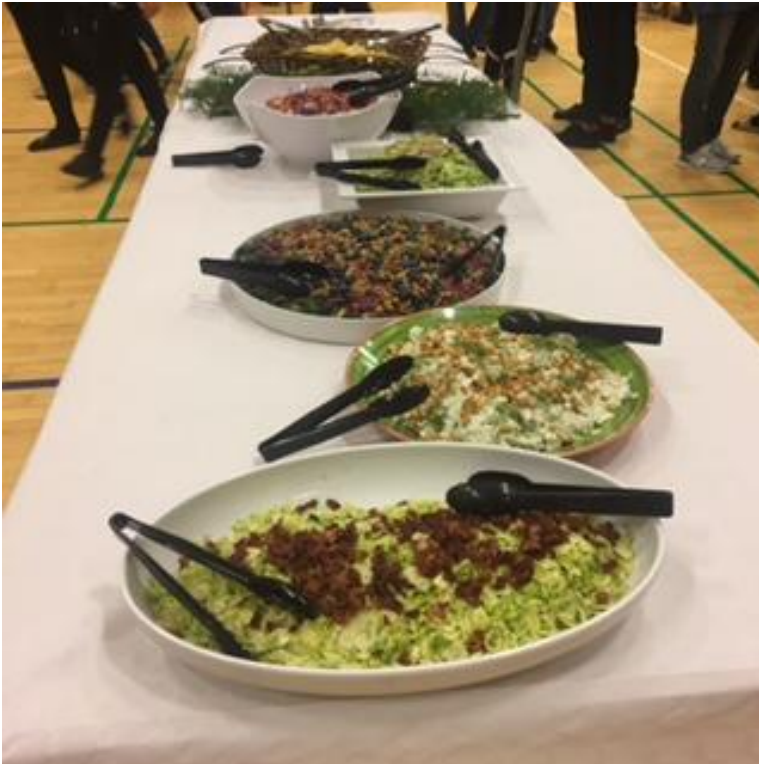
Salatbaren – mums