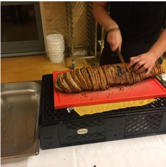
Stegen skæres for