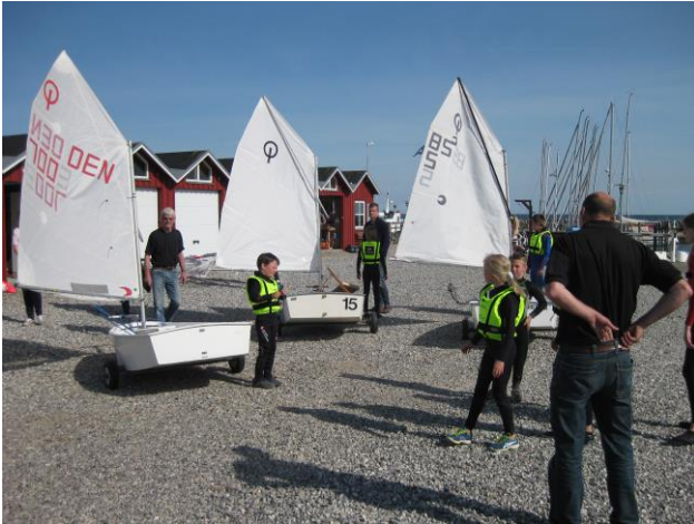
Optimistjoller rigges til